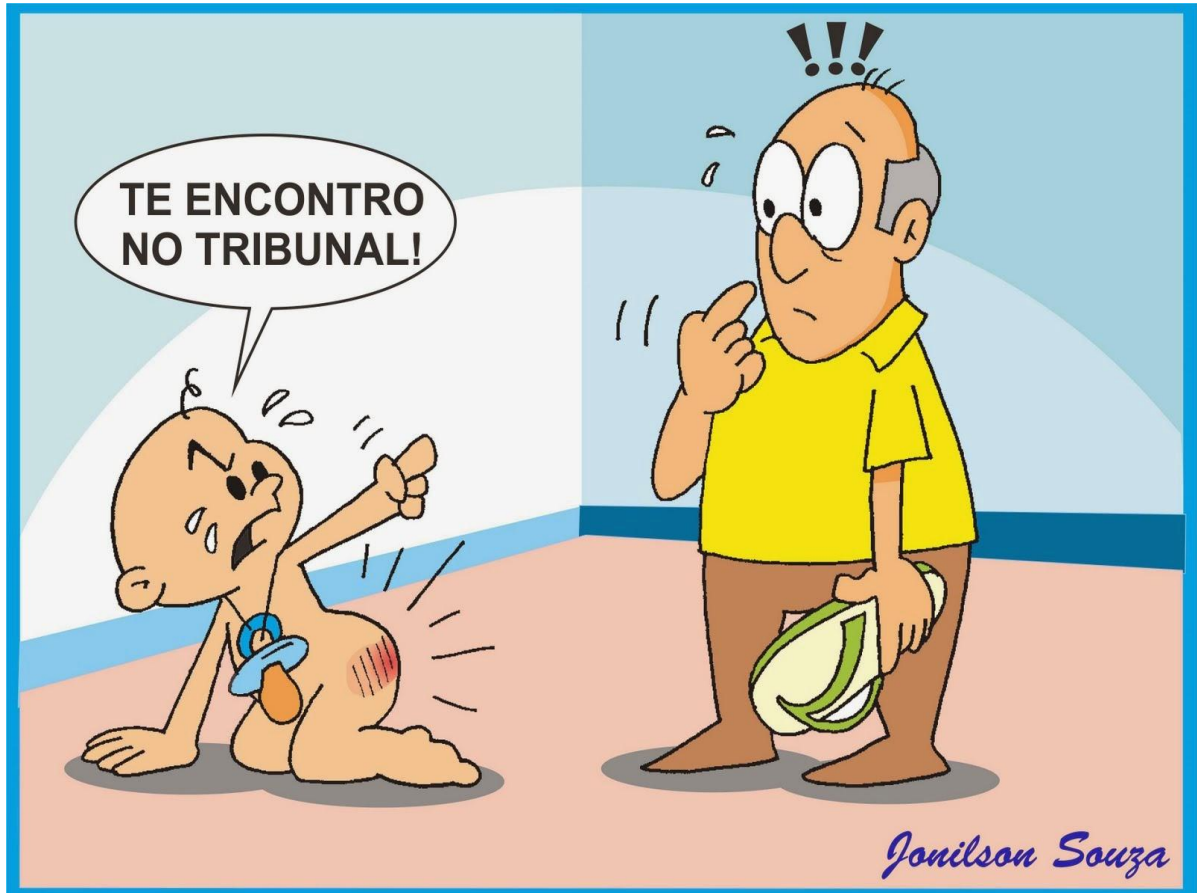
Figura 2 – “Vigilância do Estado e medo dos pais”